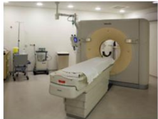
Figuur II: Tijdens de CT scan ligt u op een beweegbare tafel, die langzaam door het apparaat heen wordt geschoven.

CT staat voor computertomograaf. Door middel van röntgenstraling worden met dit apparaat organen en weefsels gedetailleerd in beeld gebracht. Tijdens het onderzoek ligt u op een beweegbare tafel, die langzaam door het apparaat (in de vorm van een ring) heen wordt geschoven. Vanuit een groot aantal hoeken rondom uw lichaam wordt een hoeveelheid röntgenstraling uitgezonden en vervolgens wordt in kleine stappen gemeten hoeveel straling is doorgelaten. De CT-scanner maakt daardoor een groot aantal foto's. Van de vele dwarsdoorsneden wordt uiteindelijk door de computer een driedimensionale weergave gemaakt. Hierop kunnen organen, bloedvaten, tumoren en eventuele uitzaaïngen bekeken worden.