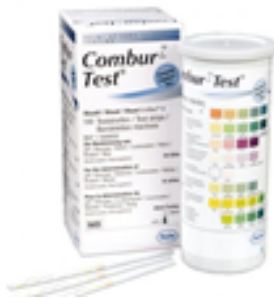
Foto: controle sticks

Het gebeurt regelmatig dat het nefrotisch syndroom weer terugkomt. Om dit goed in de gaten te houden kan je thuis je urine op eiwit controleren d.m.v. een stickje (zie foto). De dokter vertelt of je dat moet doen. Een terugval van het nefrotisch syndroom kan door (luchtweg)infecties, inenting, of spanning komen. Wanneer het nefrotisch syndroom terugkomt zal de arts kijken wat voor jou de beste behandeling is. Je moet weer starten met je medicijnen of je gaat over op andere medicijnen.