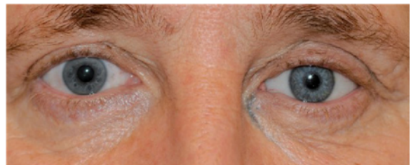
Figuur VII: een oogprothese