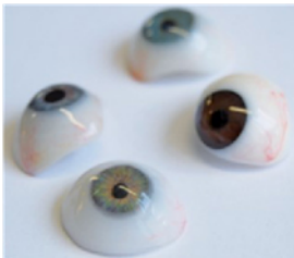
Figuur VI: verschillende oogprothesen