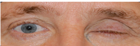
Figuur IV: het geopereerde oog zit doorgaans dicht als er nog geen oogprothese in zit.

Figuur V: bij het openen van het oog is een met slijmvlies bedekte ruimte zichtbaar.