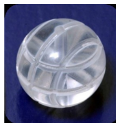
Figuur 1: implantaat