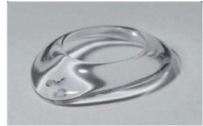
Figuur II: plastic schaal tje