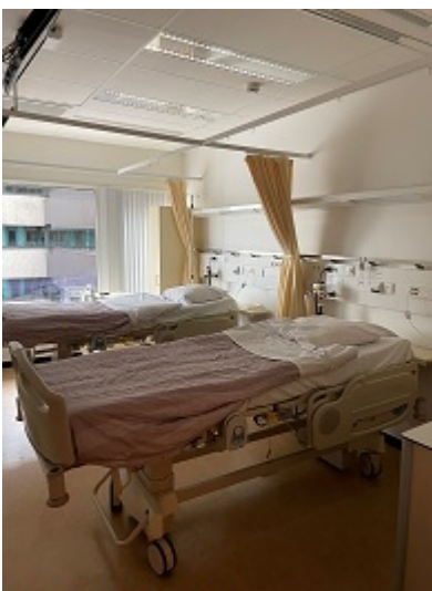
Kamer op F5Zuid

U wordt voor de inwendige bestraling opgenomen op de afdeling F5Zuid van Amsterdam UMC locatie AMC, als de CT-scan gemaakt is.