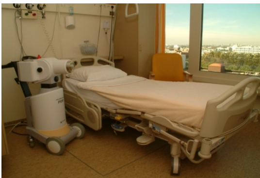
Kamer op F5Noord

Op F5- Shortstay/Bestralingsunit zijn speciale kamers. Hier vindt de inwendige bestraling plaats.