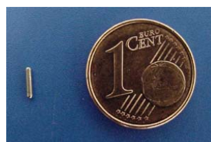
Jodium 125 zaadje