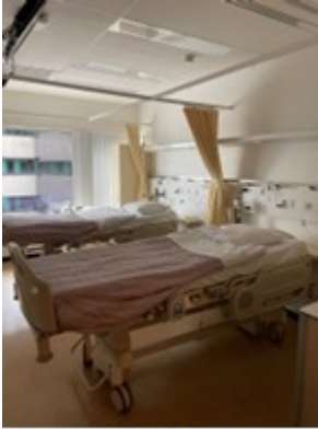
Kamer op F5Zuid

Indien u vroeg in de ochtend op de operatie kamer moet zijn wordt u de avond voor de inwendige bestraling opgenomen op de afdeling F5Z (Shortstay / kort verblijf) van Amsterdam UMC locatie AMC.