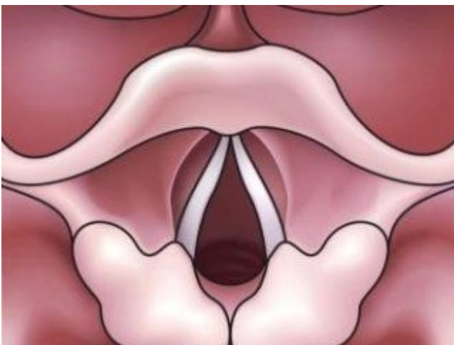
Figuur 1: Afbeelding van een normaal strottenhoofd

Hieronder ziet u een tekening van het normale strottenhoofd.