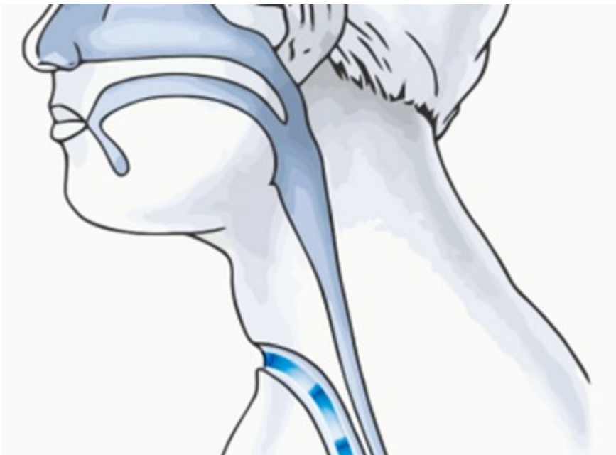
Figuur 2: Situatie na de laryngectomie