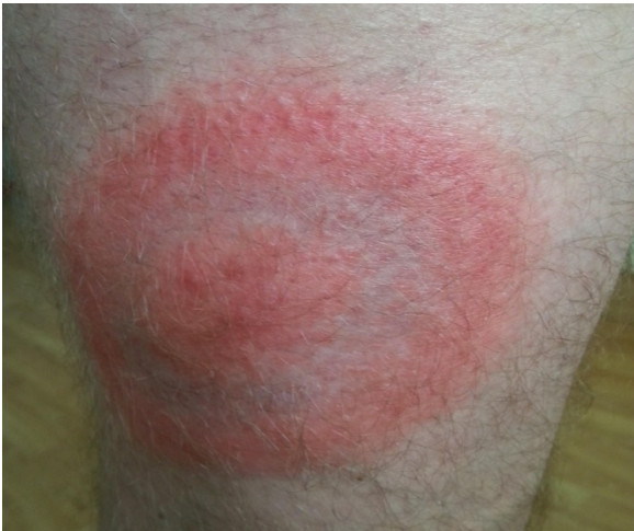
Fig. 2 erythema migrans Een vroege uiting van Lymeziekte 1