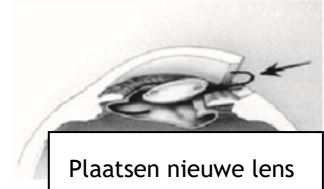
Plaatsen nieuwe lens