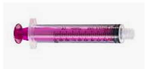
ENFit ® 10ml spuit

Gebruik hiervoor de ENFit ® -spuit (paars)