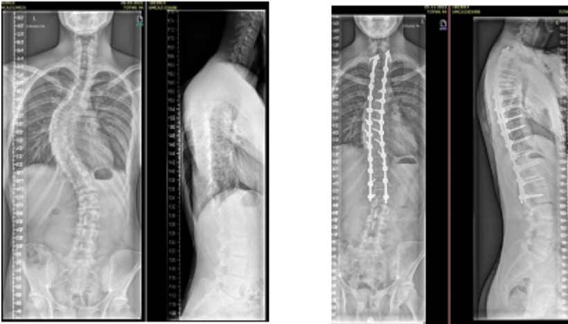
Rontgenfoto's van voor (rechts) en na (links) een operatie