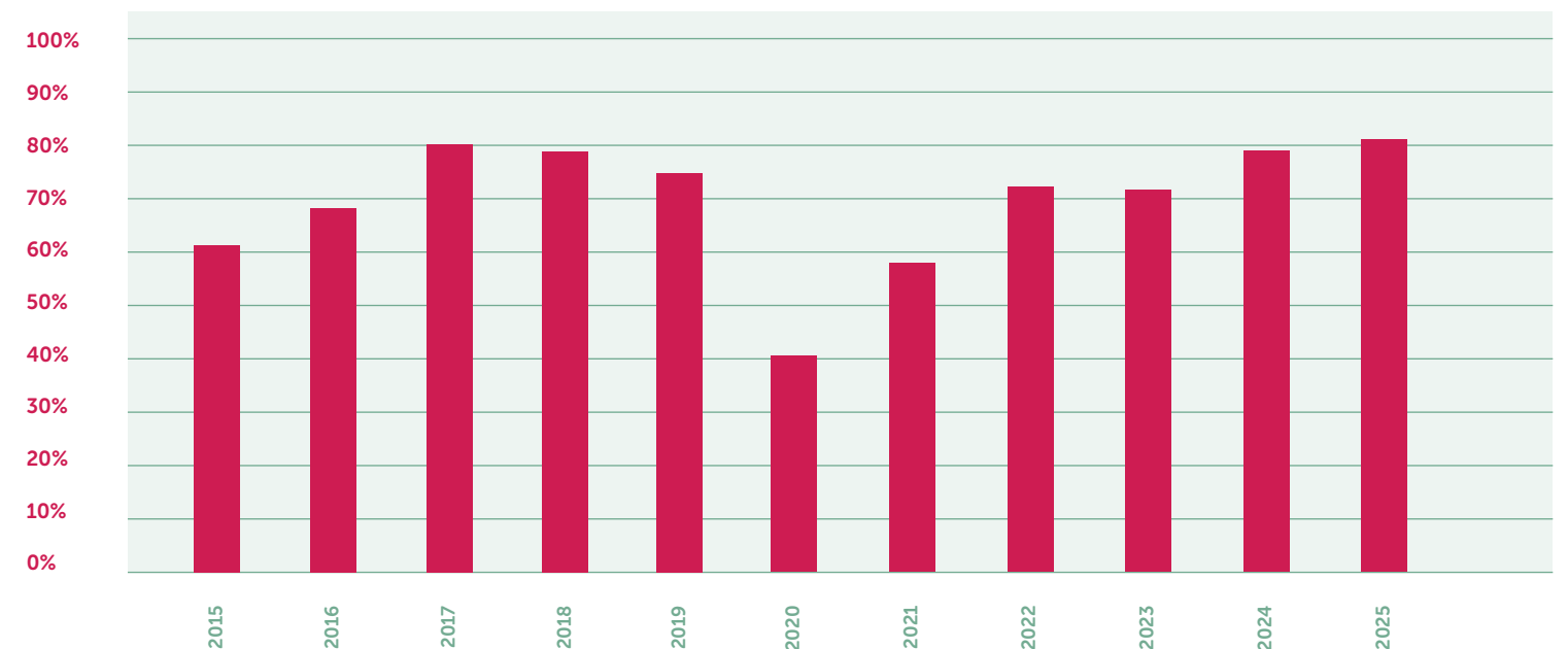
Gemiddelde kamerbezetting 2015 t/m 2025

Op voorhand is vaak niet bekend hoelang gasten blijven in verband met de onbekende duur van het verblijf van een patiënt in het ziekenhuis. Wanneer de gast eenmaal een kamer heeft, kan deze daarvan gebruik blijven maken zolang dat nodig is. In 2025 kwam het aantal overnachtingen uit op 7.429. In 2024 kwam dit aantal uit op 7.193. In 2025 maakten 12.361 gasten gebruik van het Gastenverblijf. Dit waren er in het vorige verslagjaar 12.286. In 2025 waren 47 dagen alle 25 kamers bezet. In 2024 was dit 45 dagen het geval. Uit deze cijfers kan worden afgeleid dat het Gastenverblijf drukker bezet is op doordeweekse dagen en er op vooral doordeweekse dagen soms meer aanvragen zijn dan gastenkamers.